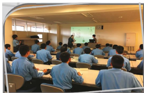
Palestra do Colega Badenes para a Polícia Japonesa

•Dia 29, ocorreu uma histórica Assembleia Geral Extraordinária (AGE) da IPA no Brasil, em que veio aprovar o Plano Estratégico de Gestão da Entidade que promoveu uma total reengenharia administrativa e de gestão na International Police Association Brasil Section – IPA Brasil, após