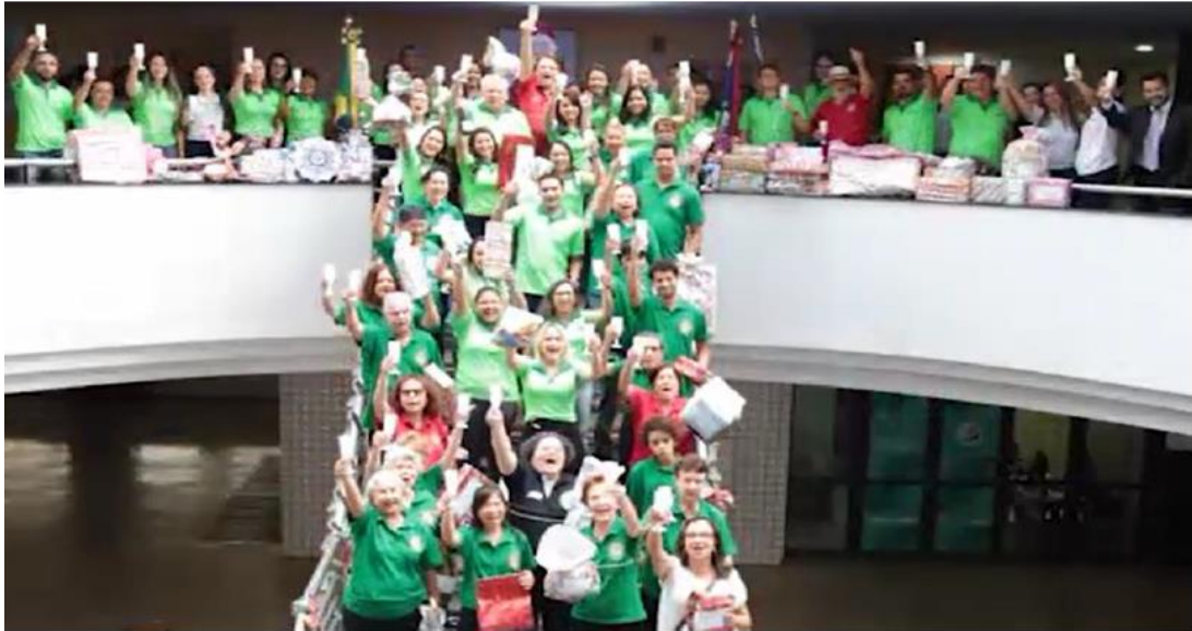
“Servo Per Amikeco (Serviço Através da Amizade)”.

ano, a conclusão satisfatória de um ano que consideramos de maior “Turbulência” para a Entidade Nacional. Superamos, agora vem a bonanza e a nova IPA do Brasil.