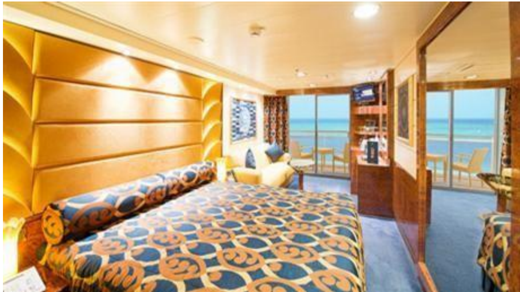
(Cabine Externa com varanda)